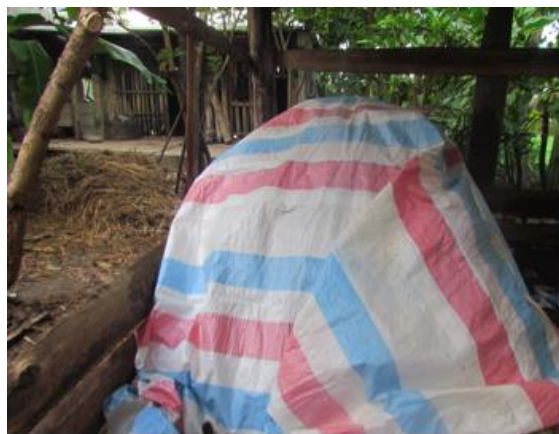
Hình 2. Mô hình ủ phân compost

Đậy đồng ủ bằng bạt để giữ ẩm và nhiệt độ ổn định, từ 7-10 ngày mở đồng ủ ra quan sát và đảo trộn, nếu khô quá thì tưới thêm nước để đảm bảo đủ độ ẩm cần thiết.