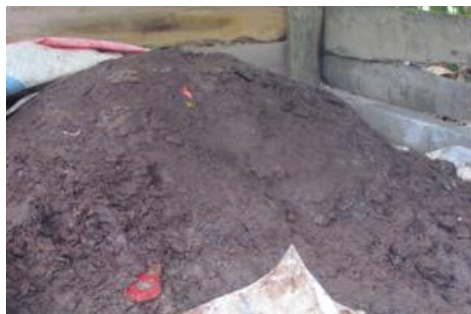
Hình 5. Đống ủ phân compost sau 60 ngày

Kết quả phân tích một số chỉ tiêu của đống ủ được thể hiện ở Bảng 11.