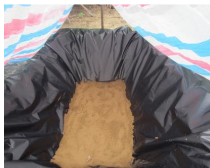
Hình 4. Mô hình ô chôn lấp quy mô hợp tác xã

Hiện nay, trên địa bàn huyện Lệ Thủy chưa có hệ thống thu gom, xử lý CTR từ nông nghiệp cho toàn bộ huyện. Do đó, ở các xã có thể xây dựng các ô chôn lấp quy mô hợp tác xã để giải quyết tạm thời vấn đề bao bì thuốc BVTV. Chúng tôi đã xây dựng mô hình ô chôn lấp CTR từ nông nghiệp tại xã Dương Thủy với kích thước H x B x L=1m x 1 m x 2m.