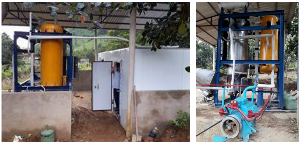
Hình 2. Hệ thống máy lạnh

Nhóm tác giả đã tiến hành tính toán thiết kế, lắp đặt và vận hành thành công, hiệu quả tốt tại cơ sở du lịch sinh thái Lái Thiêu thuộc thôn Phú Túc, xã Hòa Phú, huyện Hòa Vang, thành phố Đà Nẵng.