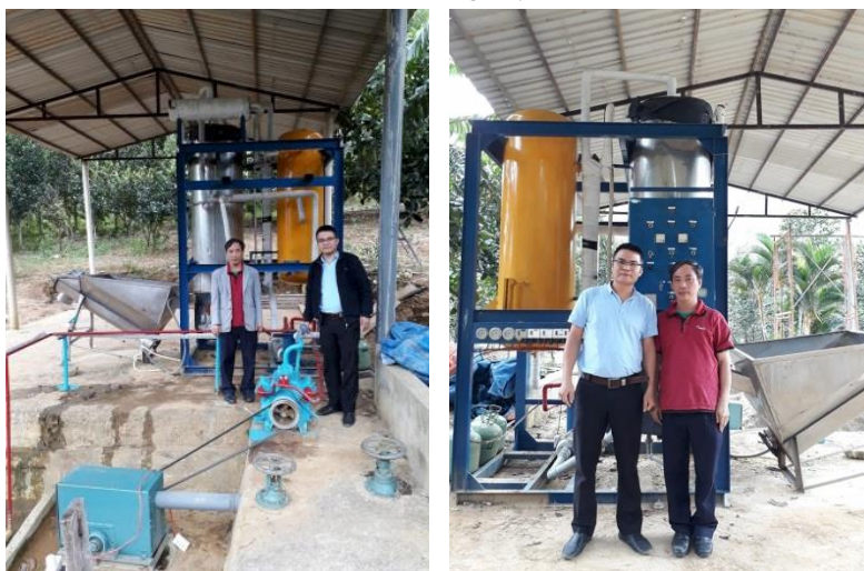
Hình 3. Thi công lắp đặt hệ thống